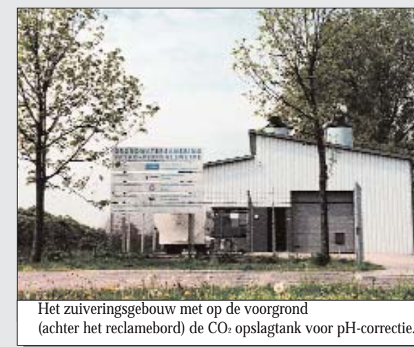
Het zuiveringsgebouw met op de voorgrond (achter het reclamebord) de CO 2 opslagtank voor pH-correctie.

• Het grondwater wordt via deepwell-onttrekking naar het zuiveringsgebouw gepompt met een debiet van 110 m 3 /h. En daarna in een influentbuffer belucht voor het uitoxideren van ijzer. Een centrifugaalpomp brengt het beluchte water naar een zandfilterinstallatie (2 parallel geplaatste filters). Voor de verwijdering van mangaan wordt kaliumpermanganaat gedoseerd. IJzerdeeltjes en mangaandeeltjes blijven achter in het zandbed. Het water wordt dan over 2 parallel bedreven striptorens geleid. Hier wordt de bulk van VOCl's verwijderd en in luchtkool geadsorbeerd.