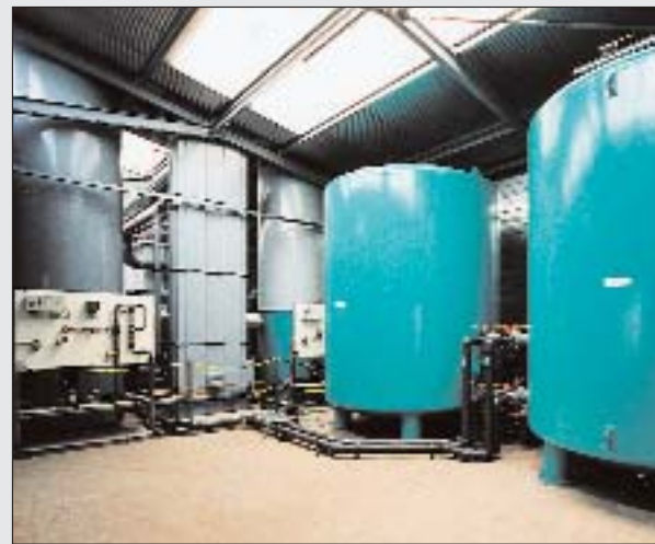
Op de voorgrond de 2 in serie geplaatste actieve koolfilters voor het infiltratiewater.