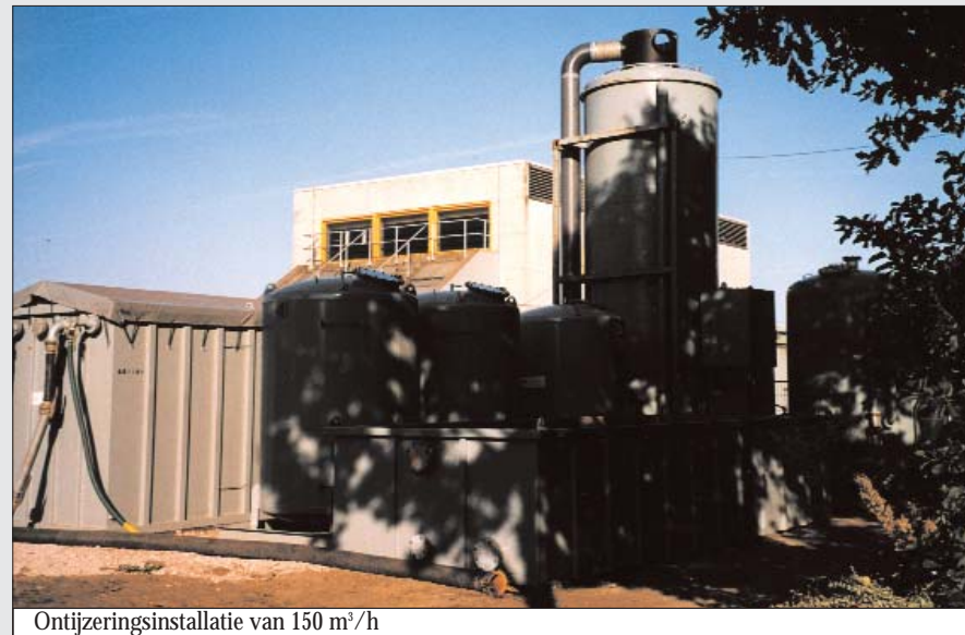
Ontijzeringsinstallatie van 150 m 3 /h