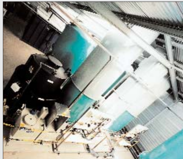
Van links naar rechts de kaliumpermanganaatopslag- en doseerinstallatie met daarvoor geplaatst de aanmaakinstallatie; de twee parallel geplaatste striptorens met daarvoor de doseerpanelen voor pH-correctie met CO 2 .