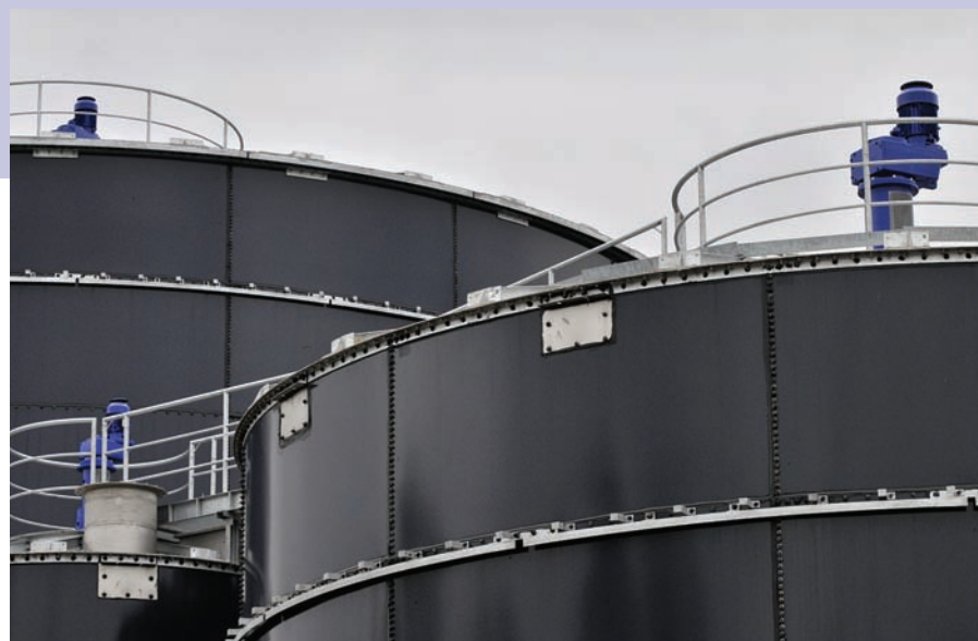
Tanks op de RWZI met de Scaba

Het DEMON-proces is vooral geschikt voor afvalwaterstromen met een hoge concentratie ammoniumstikstof. Het stikstofrijke rejectiewater dat vrijkomt bij de slibontwatering en vergisting is daarom uitermate geschikt voor de behandeling met DEMON. Er kan zo meer biogas geproduceerd worden, ook uit externe afvalstromen, zonder de rioolwaterzuivering zwaarder te belasten. Binnen Europa zijn er sinds 2004 drie full scale DEMON-installaties in bedrijf genomen en; er zijn nog drie in aanbouw. Medewerkers van het Waterschap Veluwe hebben een bezoek gebracht aan de rioolwaterzuivering in Strass in Oostenrijk om de robuustheid en het energieverbruik van het systeem te beoordelen. Met name